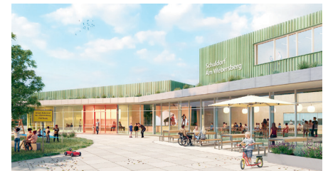
Preisträger aus vergangenen saarländischen Wettbewerben: HDK Dutt & Kist GmbH (oben links), Christensen & Co., Kopenhagen/ Code of Practice Architects GmbH/ Gustin Landskab (oben rechts) Schätzler Architekten GmbH (unten links), Planungsgesellschaft Jörg Kühn mbH (unten rechts)

Besetzung des Preisgerichts, zu den Abgabeleistungen und der Terminalschiene. Eine rechtliche Beratung ist grundsätzlich nicht möglich, aber die Ausschussmitglieder – die meisten sind erfahrene Wettbewerbsteilnehmer – berichten aus ihrem Berufsalltag und zeigen der auslobenden Seite Möglichkeiten auf, wie sie möglichst viele und qualitätvolle Entwürfe bekommen kann.